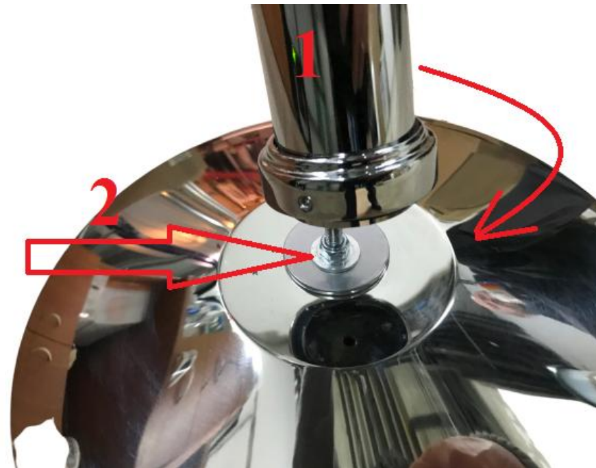
3. ВЕРХНЯЯ ЧАСТЬ СТОЙКИ (1) ПРИКРУЧИВАЕТСЯ К ОСНОВАНИЮ (2) ПО ЧАСОВОЙ СТРЕЛКЕ ВРУЧНУЮ БЕЗ КЛЮЧА ДО УПОРА