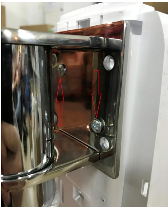
1. НАРУЖНЫЕ ШЛЯПКИ БОЛТОВ УСТАНОВЛЕНЫ БЕЗ ШАЙБ

с дозаторами под картридж гель - K_DHB123_SHB002, под картридж спрей - K_DHB403_SHB002